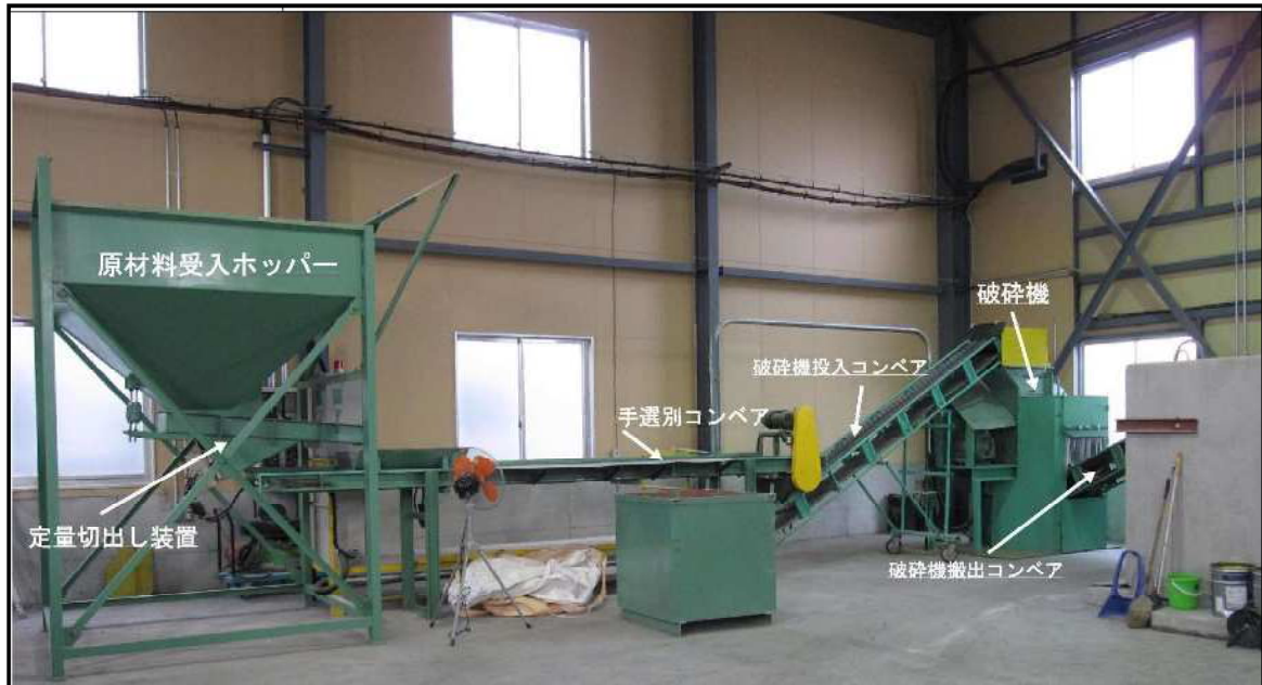
図-1 廃棄ピン類破砕施設処理工程