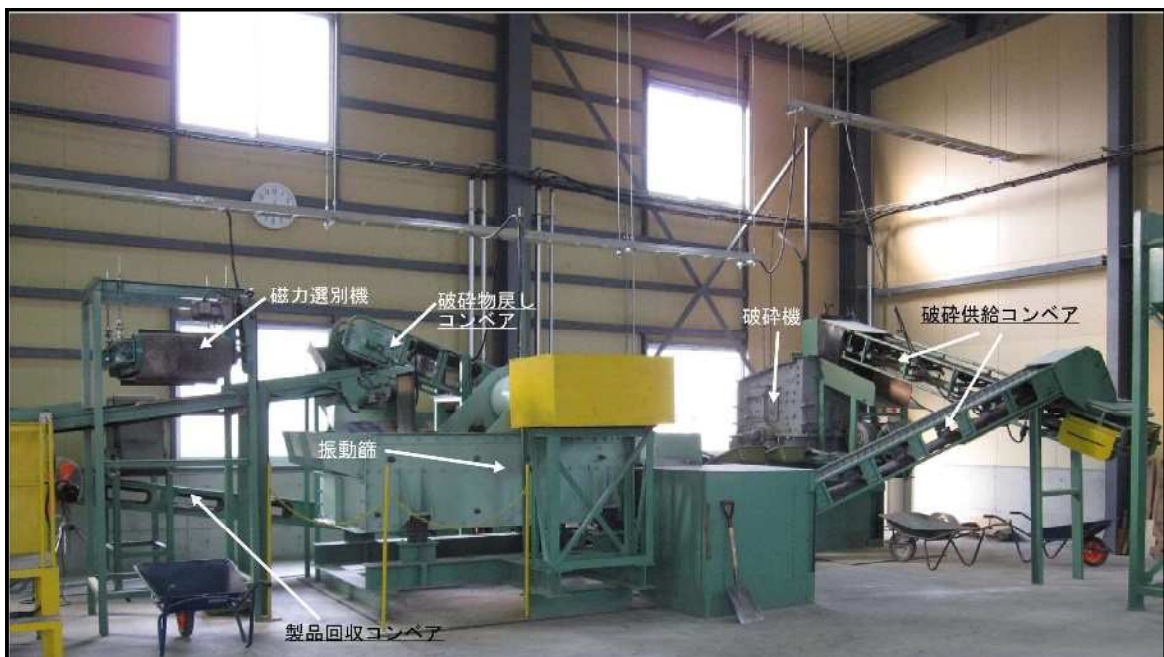
図-2 建材板ガラス等破砕施設処理工程