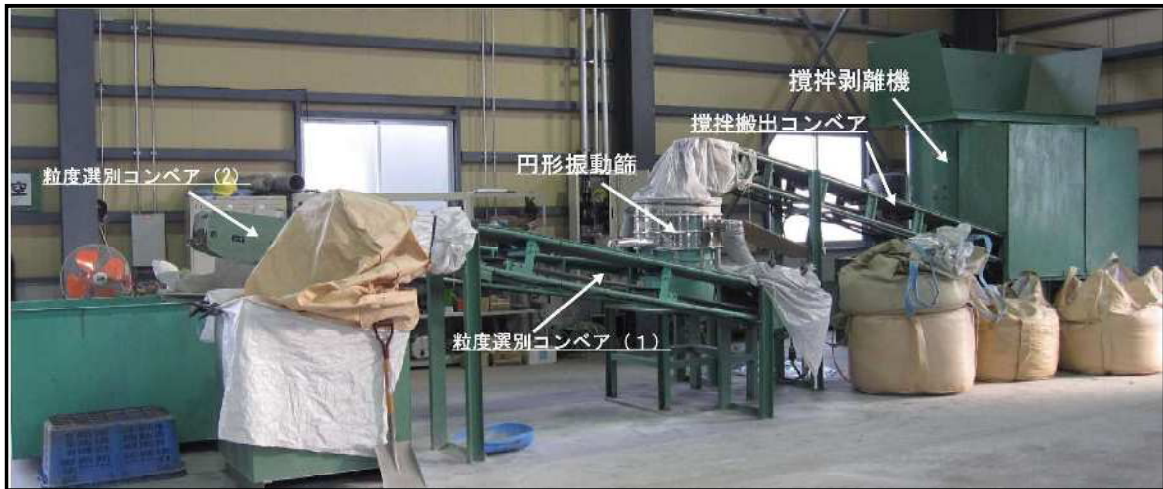
図-3 太陽光パネル等破碎・選別処理工程